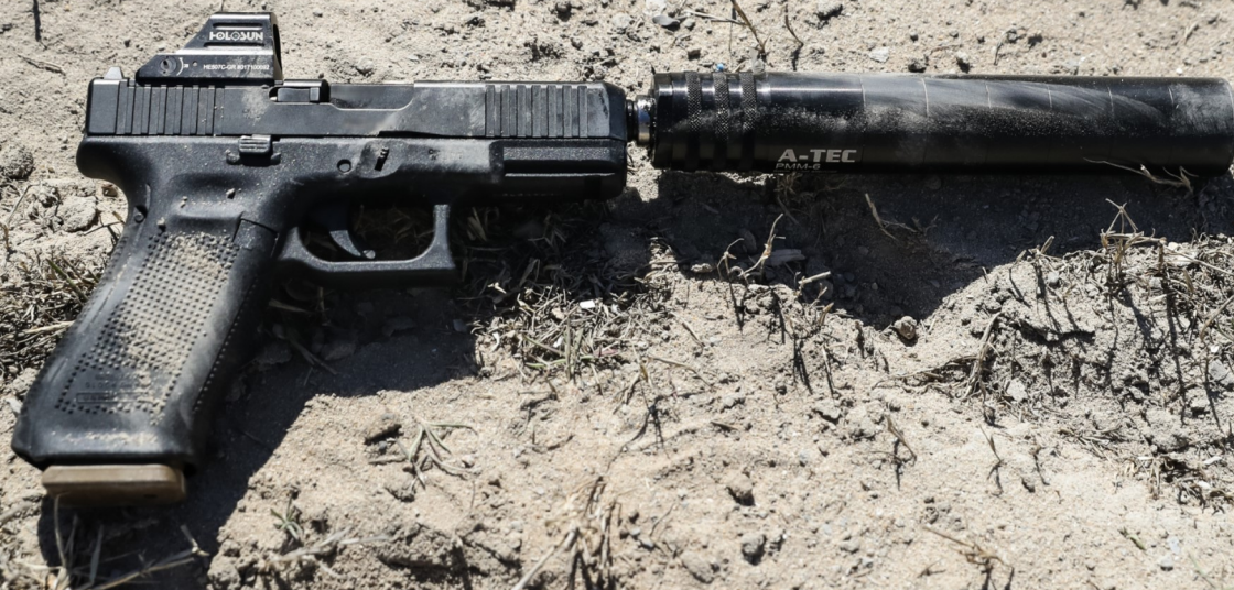
12 - GLOCK 45, EM 9X19MM, EQUIPADA COM SILENCIADOR A-TEC E MIRA HOLOGRÁFICA HOLOSUN 507C.